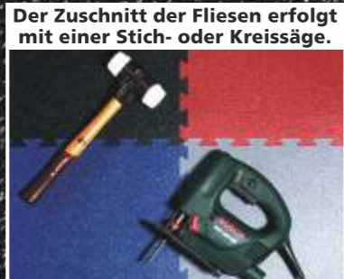
Der Zuschnitt der Fliesen erfolgt mit einer Stich- oder Kreissäge.