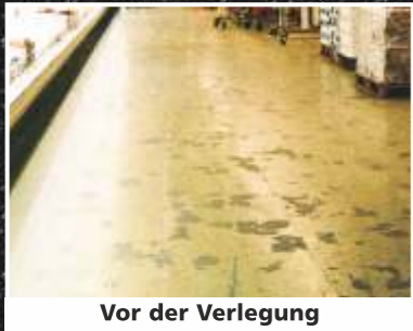
Vor der Verlegung