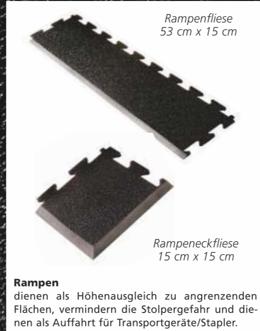
Rampenfliese 53 cm x 15 cm