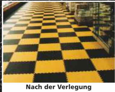
Nach der Verlegung