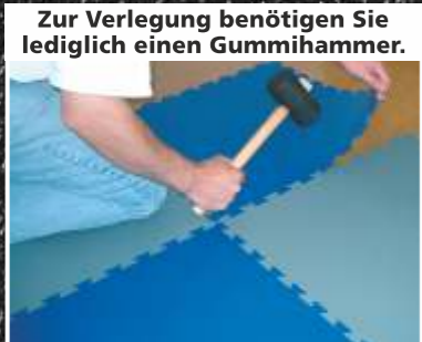
Zur Verlegung benötigen Sie lediglich einen Gummihammer.